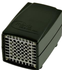
Hand Warmer (P012-62)